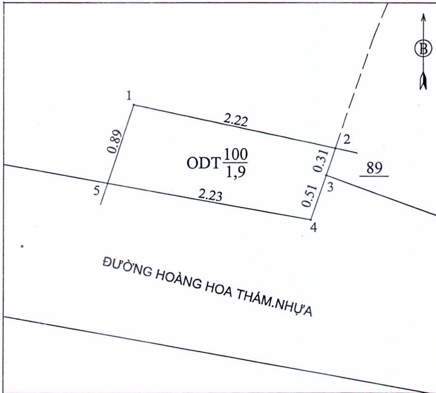
7.2. BẢNG KÊ TỌA ĐỘ